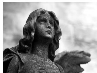
Sveti arkanđeo Mihael