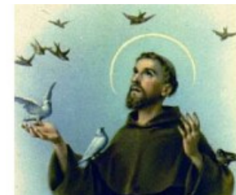
Sv. Franjo Asiški (1181.-1226.)